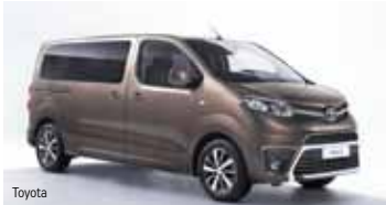
Der Proace. Ein Alleskönner in 3 Ausstattungsvarianten.