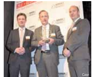
Preisverleihung bei den SIMA Innovation Awards

Case IH wurde bei den Innovation Awards der internationalen Landmaschinenmesse SIMA in Frankreich mit einer Silbermedaille ausgezeichnet. Diese Medaille unterstreicht das Potenzial des autonomen Konzeptfahrzeuges, eine fahrerlose Version des Case IH Magnum CVX. Precision Farming und die Automatisierung von Landmaschinen spielt bereits heute eine Rolle bei der Verwirklichung einer effizienteren, ökonomisch wertvollen und umweltfreundlicheren Landwirtschaft. Das autonome Traktorkonzept basiert auf dem PS-starken, konventionellen Traktormodell Case IH Magnum und ist mit der AccuGuide-Lenkautomatik sowie dem ultrapräzisen RTK+ GPS von Case IH ausgestattet. Dies ermöglicht eine Fernsteuerung mit sofortiger Aufzeichnung und Übermittlung der Felddaten. Mit autonomen Traktoren lassen sich Wetterfenster auch ohne überlange Arbeitszeiten bestens nutzen. Naturgemäß eignen sie sich am besten für Arbeiten mit vorgeplanter Wegeführung. Wenn die Wege definiert sind, wählt man das Fahrzeug und das Feld und schon kann der Traktor seine Aufgabe in Angriff nehmen. Der Case IH bietet einen Blick in die Zukunft unserer Landwirtschaft, denn noch sind die Kosten für autonome Traktoren zu hoch um kostendeckend betrieben werden zu können.