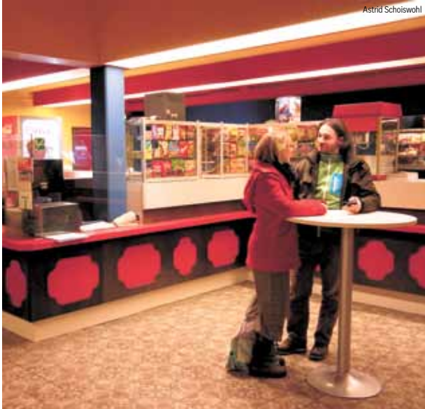
Das Feldbacher Kino ist Kult. Das Foyer erinnert an die 70er Jahre und ist damit moderner denn je.