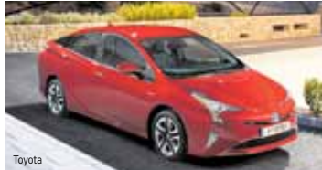
Der Prius. Ein umweltfreundliches Familienauto.

Toyota PROACE VERSO und Toyota Prius erreichten im Euro NCAP Crashtest-Programm mit 5 Sternen die höchstmögliche Bewertung. Bestmögliche Sicherheit kann im Ernstfall durch nichts ersetzt werden. Für die besondere Art des Reisens bietet der Toyota Proace Verso Platz für bis zu neun Passagiere plus Gepäck und das in 3 Ausstattungsvarianten sowie in 3 verschiedenen Längen. Die Auswahl reicht vom Proace Verso 1.6 D4D Shuttle Compact mit einem 1,6 Liter Dieselmotor mit 85kW/116PS, bis hin zur exklusiven „VIP“ Version mit 177 PS, 2 Liter Hubraum und langem Radstand.