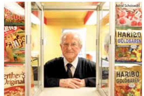
Ein Leben fürs Kino Seite 12