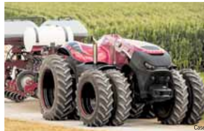
Satelliten und computergesteuerter Traktor Case IH