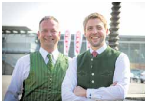
Am Wort – die beiden Gady Geschäftsführer Seite 6 & 7